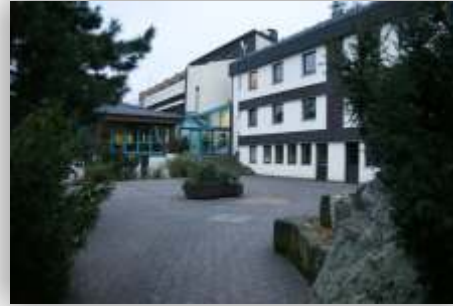
Impressionen von der Rüstzeit