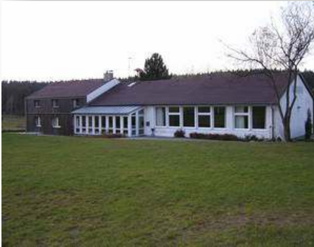
Unser Rüstzeitheim 2011