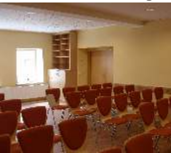
Fertigstellung am 30. Juni 2012