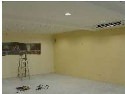
Decken und Wandge- staltung Juni