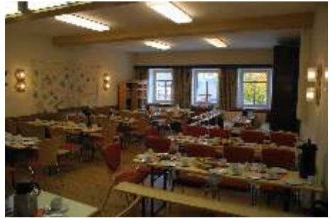
Gemeindesaal Oktober 2010